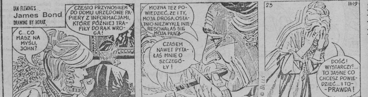
Następny odcinek jutro

wad wzroku, nie wystarczy. Pielęgniarka wzięła dodatków skierowania na badania neurologiczne, okulistyczne, OR, morfologię i moczu.