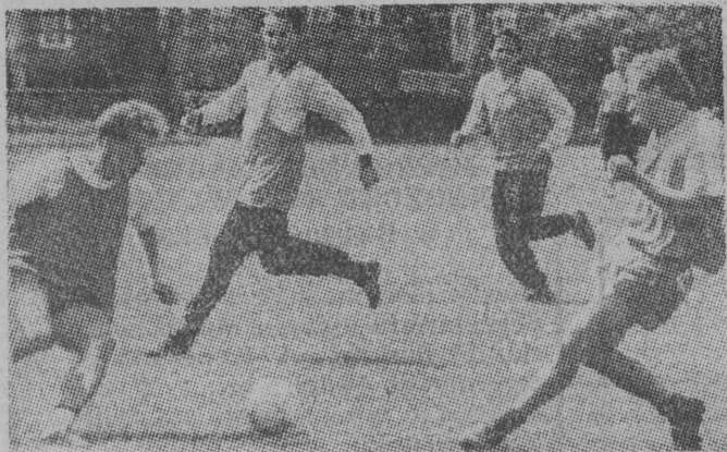
Jeden z elementów szybkiego kontrataku przerabiany był wielokrotnie podczas wczorajszego treningu.