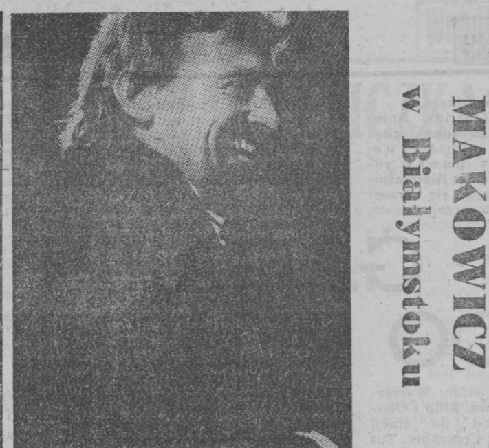
MAKOWICZ w Białymstoku