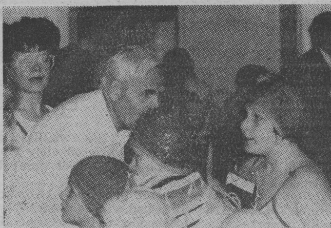
Pierwsze gratulacje po zdobyciu karty pływackiej i uczestnictwie w zawodach złożył... dziadek.