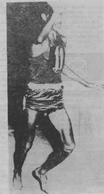
Na zdjęciu. Bikila Abebe

ków radzieckich. Grudzień pokonał Bazarnikowa, Kulej zwyciężył Fiałowa a Kasprzyk — Tanulisa. Ta walka była najbardziej dramatyczna. Kasprzyk już w pierwszej rundzie doznał złamania kciuka prawej ręki. Wytrzymał ból i nie dał poznać po sobie,