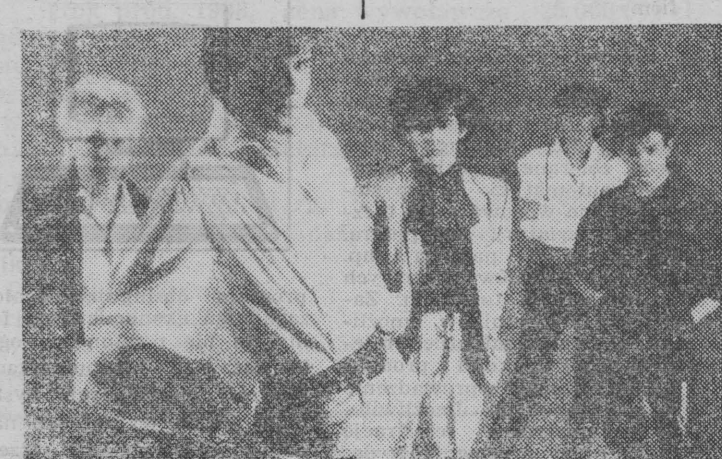
Duran Duran — człł od lewej: A. Taylor, S. Le Bon, N. Rhodes, J. Taylor, R. Taylor.

fanów, którzy przybyli do Warszawy z całego kraju. W 1978 r. powstaje najpopularniejsza chyba grupa okresu New Romantic — Duran Duran. Ze względu na urodę muzyków cieszyła się ona niebywałym powodzeniem wśród milionów dziewczyn. Nawet księżna Diana była gorącą wielbiczką Simona Le Bon oraz jego przyjaciół Nicka Rhodes’a, Andy’ego, Johna i Rogera Taylorów. Bardzo ciekawy jest fakt, że ci trzej ostatni nie byli ze sobą spokrewnieni.