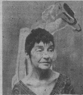
Fot. Zdzisław Lenkiewicz

każdy rodzi się z szansą dobrego odbioru. — Czy współczesny świat, napęczniały groźnymi wyścigami dalszy na str. 2