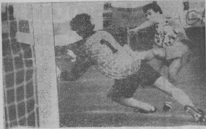
Sobotni mecz na pewno nie będzie należał do najlepszych ws...