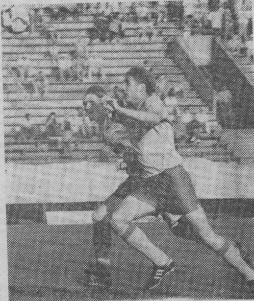
Kto szybciej w biegu po piłkę.

W tabeli prowadzi Polonia W-wa – 8 pkt., przed Stalą Rzeszów – 7 pkt. oraz Motorem i Stalą Stalowa Wola po 6 pkt. Ostatnie miejsce zajmuje Korona Kielce bez zwycięstwa.