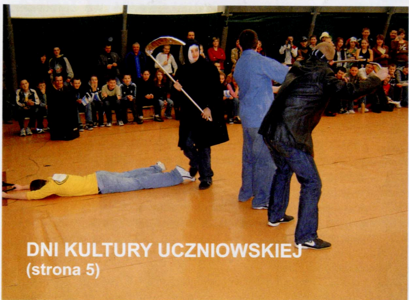
DNI KULTURY UCZNIOWSKIEJ (strona 5)