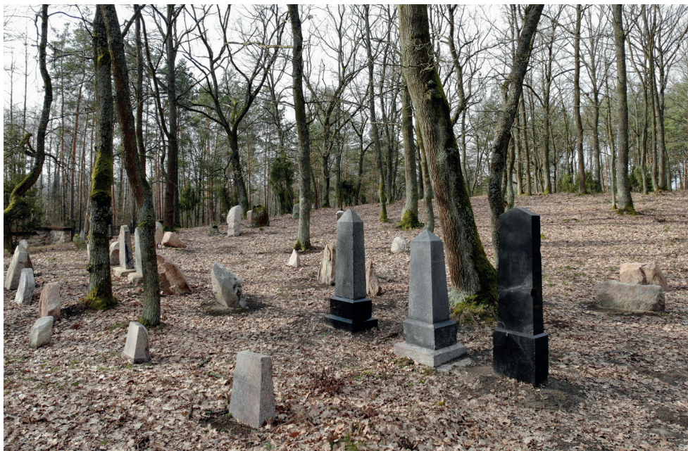
11. Zastawek. Zastawek.

ziono pod budowę dróg. W 1959 r. cmentarz został wpisany do rejestru zabytków. Mimo to nagrobki w dalszym ciągu były rozkradane, przeważnie na potrzeby firm kamieniarskich.