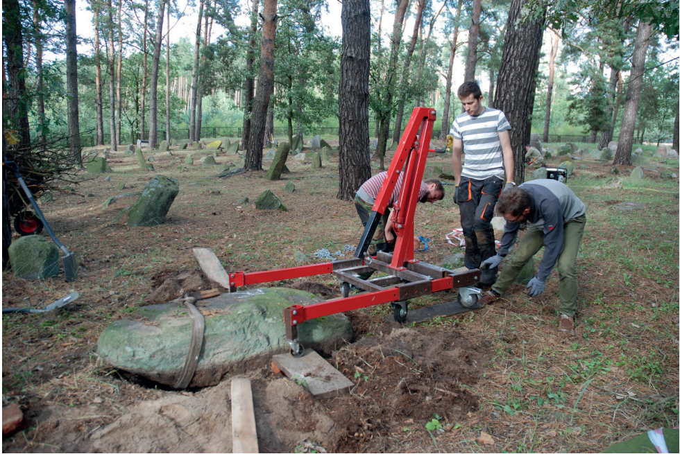
8. Cmentarz w Studziance. Konserwatorzy przy pracy. Cemetery in Studzianka. Conservators at work.