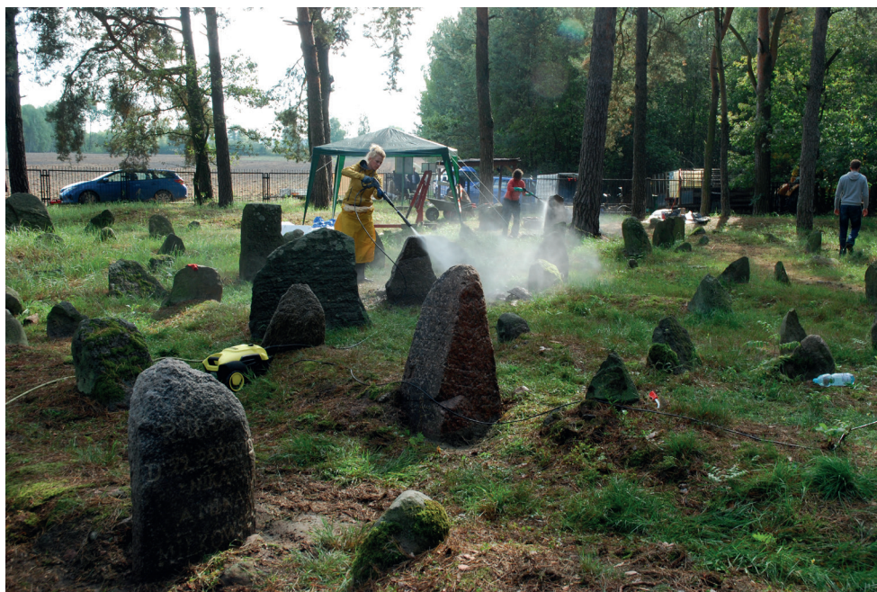
7. Cmentarz w Studziance. Konserwatorzy przy pracy. Cemetery in Studzianka. Conservators at work.

Z zachowanych historycznych fotografii widać, że część nagrobków uległa zniszczeniu wskutek dewastacji i kradzieży, mimo to przetrwały na nim różne rodzaje nagrobków. Przeważają oczywiście nagrobki tradycyjne w formie polodowcowych głazów, ale są także marmurowe i piaskowcowe stele, a nawet pomnik w kształcie granitowego sarkofagu.