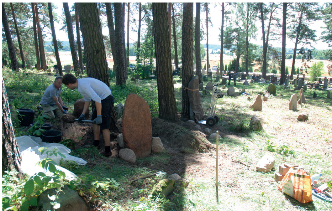
2. Cmentarz w Bohonikach. Konserwatorzy przy pracy. Cemetery in Bohoniki. Conservators at work.

szący inskrypcjom polskim. Na starszych nagrobkach licznie występują inskrypcje rosyjskie.