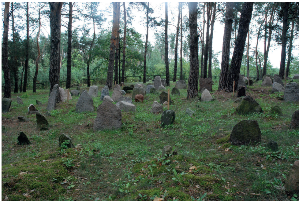
6. Cmentarz w Studziance. Widok ogólny. Cemetery in Studzianka. General view.

miejsce w 1941 r., choć najmłodszy zachowany nagrobek pochodzi z 1927 r. Wcześniej w 1915 r. wycofujące się wojska rosyjskie spaliły meczet, co doprowadziło do zaniku tatarskiego charakteru miejscowości. Muzułmańscy mieszkańcy rozprzeczli się po świecie. Część przeszła na katolicyzm. Ostatnia tatarska mieszkanka Studzianki zmarła w 2006 r. Nie wyznawała już islamu.