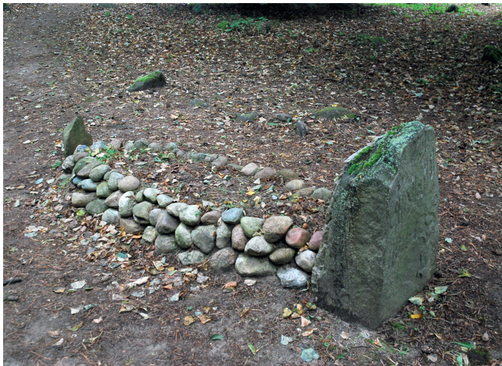
5. Cmentarz w Kruszynianach. Niefachowo przeprowadzona konserwacja polegająca na zbytym ucytelnieniu pola grobowego okładzinami z kamieni. Cemetery in Kruszyniany. Improperly executed conservation involving excessive delineation of grave sites with stone coverings.

w latach 2021–2022 na cmentarzu, podczas których pracom poddano łącznie 90 obiektów. Program prac był podobny jak na cmentarzu w Bohonikach. Przy wyborze nagrobków kierowano się przede wszystkim potrzebą uporządkowania przestrzeni mizaru poprzez ustawienie przechylonych, przewróconych oraz zapadniętych w ziemię kamieni nagrobnych, przywracając im pierwotne miejsce i pozycję. Nieznacznie przechylone obiekty pozostawiono bez ingerencji, dla zachowania właściwego klimatu tego miejsca 6 .