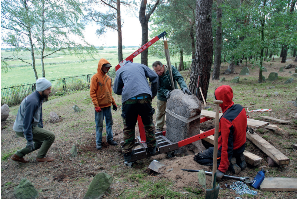
9. Cmentarz w Studziance. Konserwatorzy przy pracy. Cemetery in Studzianka. Conservators at work.