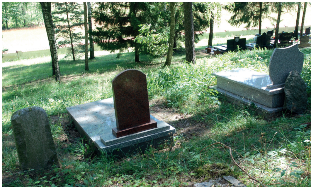
1. Cmentarz w Bohonikach. Widoczne współczesne, ahistoryczne nagrobki. Cemetery in Bohoniki. Modern, non-historical tombstones visible.

prac archeologicznych (na początek georadarowych), które pozwoliłyby na próbę określenia charakteru cmentarza. Wobec braku dokumentacji historycznej, uzasadniającej wpis do rejestru zabytków, cmentarz do dzisiaj nie ma ochrony prawnej 4 . Jest cmentarzem nieczynnym, ogrodzonym wtórnym metalowym ogrodzeniem z siatką.