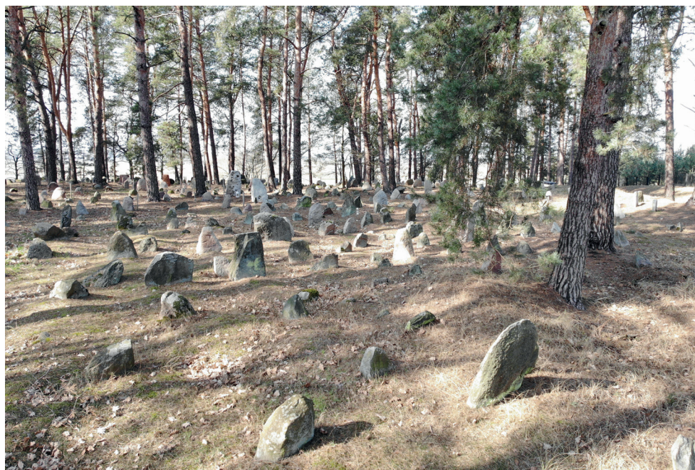
10. Cmentarz w Studziance po pracach konserwatorskich.  Cemetery in Studzianka after conservation works.

Cmentarz w Zastawku (Lebiedziewie) prawdopodobnie powstał przed cmentarzem w Studziance. Chowano bowiem na nim członków studzianeckiej gminy tatarskiej. Jest on nieczynny od czasu I wojny światowej. Był mocno dewastowany, zwłaszcza podczas II wojny światowej, kiedy gros nagrobków wywie-