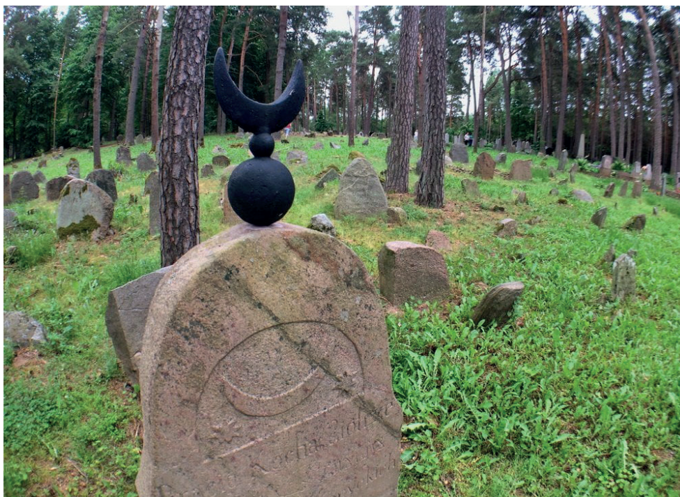
4. Cmentarz w Kruszynianach. Widok ogólny. Cemetery in Kruszyniany. General view.

na jest natomiast najstarsza część cmentarza. Nagrobki pochodzące z przełomu XVII i XVIII wieku mają formę nieociosanych głazów i przeważnie nie posiadają inskrypcji. Najdawniejsza inskrypcja nagrobna (zawierająca datę śmierci, ale już nie nazwisko osoby pochowanej) pochodzi z 1699 r., co czyni kruszyniański nagrobek najstarszym nagrobkiem na Podlasiu. Ryte inskrypcje nagrobne są przeważnie w językach polskim i arabskim, zaś po 1863 r. także po rosyjsku. Dziewiętnastowieczne inskrypcje zawierają również stopnie wojskowe, ordery czy nazwę formacji, w której zmarły służył. Oprócz typowej formy nagrobków tatarskich, wykonywanych przeważnie amatorsko, na cmentarzu zachowane są historyczne XIX-wieczne nagrobki w postaci piaskowcowych, marmurowych czy granitowych steli, wykonywanych już przez profesjonalnych kamieniarzy.