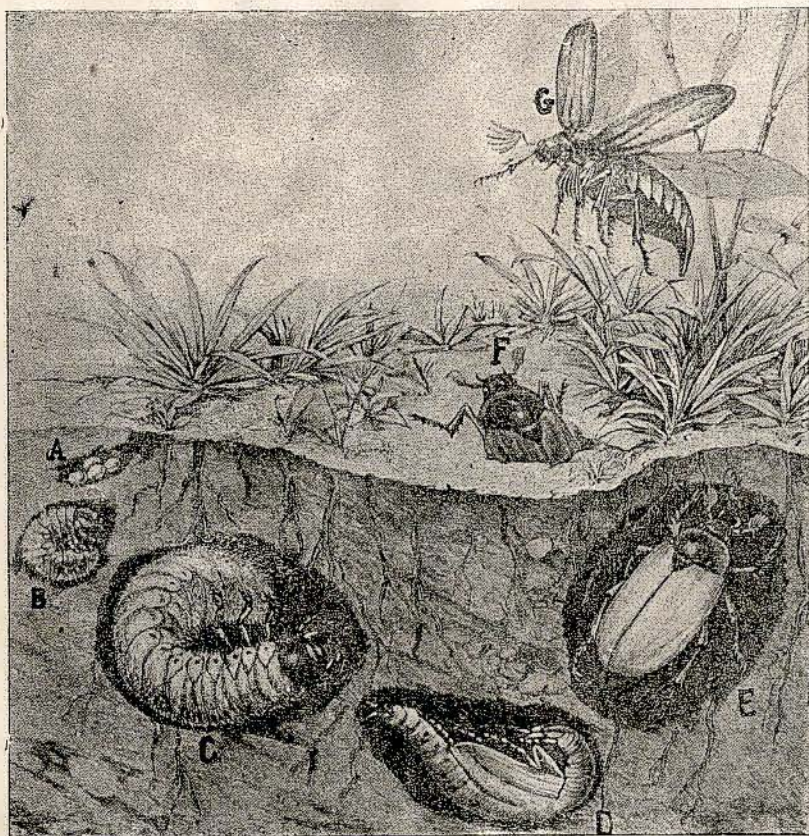
ROZWÓJ CHRABĄSZCZA: A = jaja; B, C = pędraki; D = poczwarka; E = chrabąszcz z ziemi przed wylotem; F = samica wydobywająca się z ziemi; G = samiec.

Chrabąszcz pojawia się zazwyczaj co 4—5 lat (zależnie od gatunku) w maju. Larwy chrabąszcza (pędraki) wylęte z jaj przebywają w ziemi 3—4 lata, podgryzając korzenie roślin uprawnych. W trzecim lub czwartym roku życia pędraki zamieniają się w poczwarki i następną wiosną wylęgają się z nich chrabąszcze.